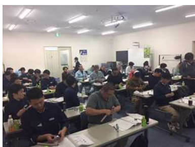
ガス可とう管資格研修