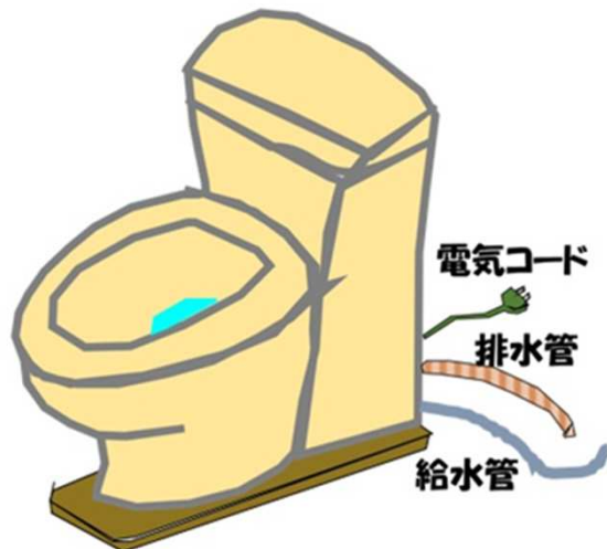
画2 どこでもトイレのイメージ

このトイレにはキャスターが付いていて室内では動かすことができます。給水管と配水管はフレキシブルパイプである程度の移動はできるのです。給排水管接続はリフォームなどの際に壁に設置し、接続していないときは蓋をしておきます。固形物を寸際しているので建物壁体などの排水管も細いままでも可能と考えられます。ただし、注意点はにおいや虫などの侵入を防ぐ、トラップは付けるとWトラップになりますのでしっかりと蓋で防ぐことになります。