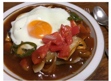
あんかけスパゲッティ

2.2mmの極太麺って初めてだったんですけど、茹でるのに13分もかかるんですね！具は友人のオススメ通りにキノコとウィンナーと玉ねぎをたっぷり目にして、調理例の写真に載っていた目玉焼きもトッピング。ここであんをかけたところ、思っていたよりルウみたいに重た目な感じで表面に溜まってしまい、どっさり入れた具が完全に見えなくなってしまいました。順番間違えた。。。