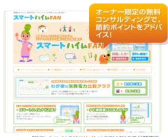
[スマートハイムFAN]サイトは2011年10月公開予定。