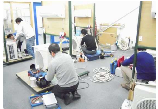
3/13エコリフォームセンターにて エアコン設置研修を行いました