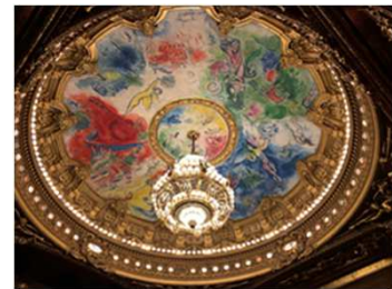
パリ オペラ座の 天井画『夢の花束』