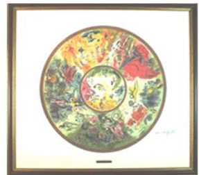
天井画のリトグラフ