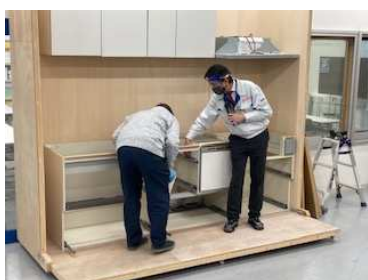
キッチン施工研修