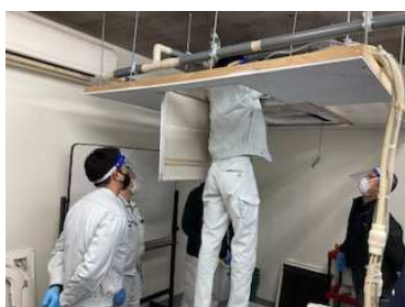
パッケージエアコン施工研修