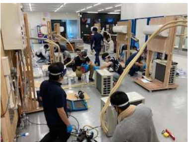
エアコン施工研修