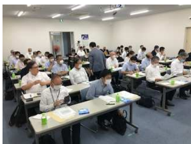
感染症対策セミナー