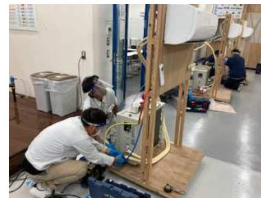
エアコン施工研修