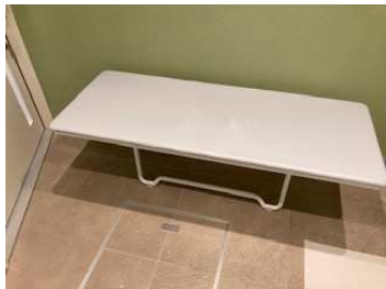
折りたたみベット