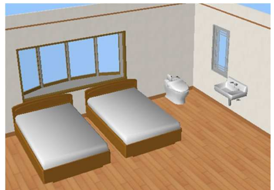
画1 壁の無いトイレ、天井にスクリーン