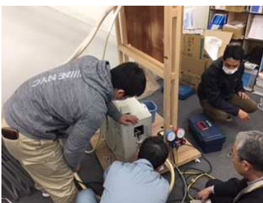
エアコン施工研修