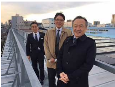
九州電力様見学会