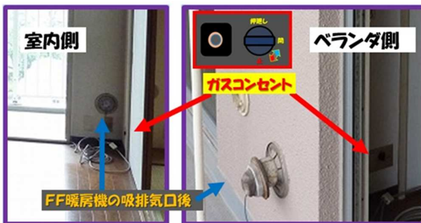
画1 FF暖房用ガスコンセントと吸排気ダクト後

このケースで事前調査をする場合、よく調べてほしいことは室内のガスコンセントとFF暖房機の壁貫通ダクトです。深夜電力貯湯槽のマンションの多くは、建築時の年代から室内にリビングなど室内にガスコンセントが付いている場合があります。そして、ガスコンセントは食卓テーブルの卓上コンロの場合もありますが、リビングなどの場合は暖房用のケースもあります。