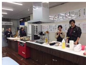
東雲フリマ連動催事