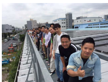
城東職業能力開発C様