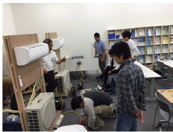
エアコン施工研修