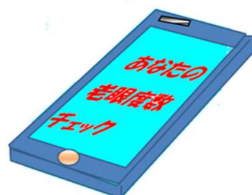
画1 年齢と平均的老眼度数