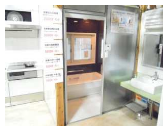
浴室の段差解消、出入口 拡大、脱衣所暖房