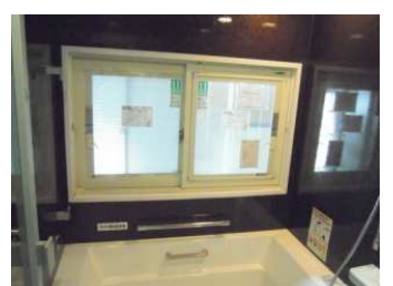
保温浴槽またぎ400mm 浴室用リフォーム内窓