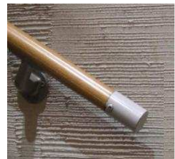
画3 手すり端部に問題

例えば画1は、ごく一般的な階段の手すりの画像ですが、どういう訳か2本並行に付けられています。その内、上側ステンレス手すりは、この建物新築当時に付けられていたもので、下側ラミネートされた手すりはバリアフリー対策等でその後に追加して付けられたものです。