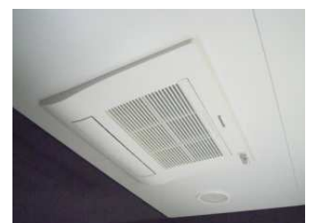
ヒートポンプ式バス換気 乾燥機、暖房付