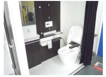
パナソニック製便器 カベは輻射熱暖房