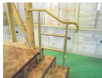
天吊り型ドアに改修 居室への段差解消