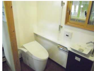
立ち上がり用手すりを便器側面とカベに設置