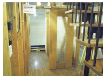
天吊り型ドアに改修 居室への段差解消