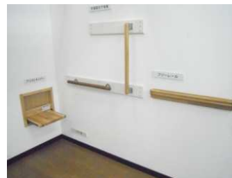
パネ協提案の廊下・居室用 てすりと玄関用シート