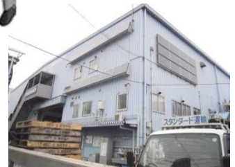
東雲エコリフォームセンターの南面と西面に24枚の太陽電池パネルを設置しました