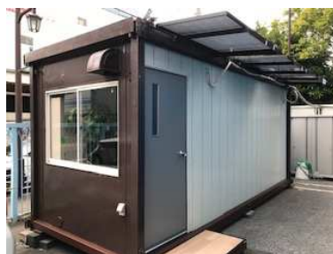
物流部門事務所完成