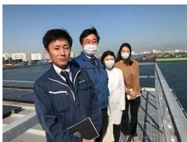
浅野商事様見学会