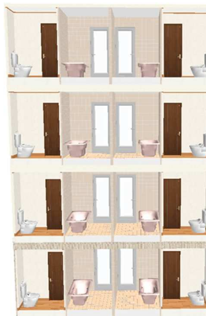
画2 各階の浴室、トイレ