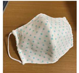
手作り立体ガーゼマスク

これで万全とは行きませんが、どうか罹患しないで済みますように！皆さんもアルコール消毒や手洗いを徹底して行って下さいね！