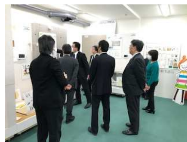
東京ガス公共営業部様