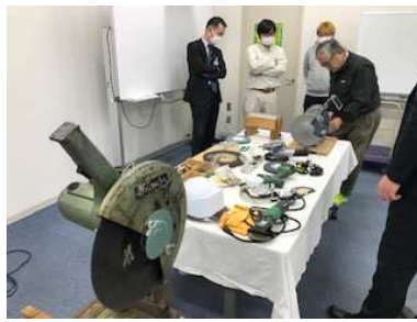
砥石実習実演研修