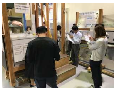
シスバス現調研修