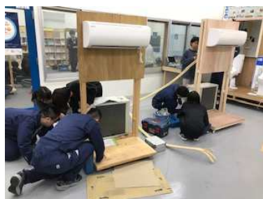
HAT新人エアコン研修