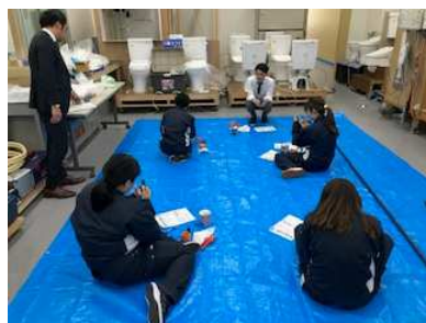
丸ノ内工業様研修会