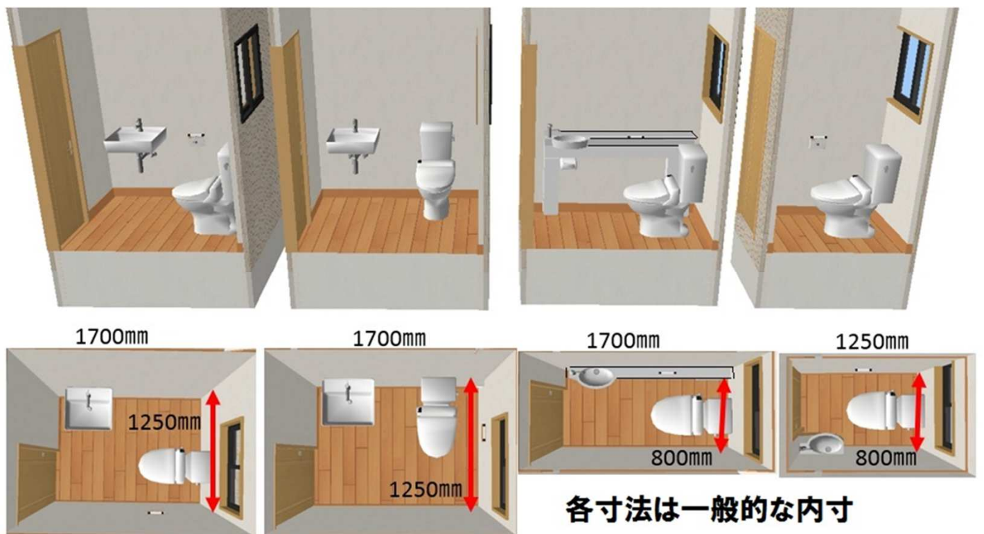
画1 一般的なトイレと内寸法

トイレのスペースは畳で表現すると①畳一枚の75%(長手方向を1365mm)、②畳1枚、③畳1.5枚の3種が主流だと思います。和室に入って畳1枚分を見るとそれなりに広い気もしますが、実際には壁芯で4方にある壁厚の関係で内寸的には、① 800×1250mm、② 800×1700mm、③ 1250×1700mmとなります。