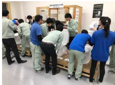
三ツ輪産業様研修会